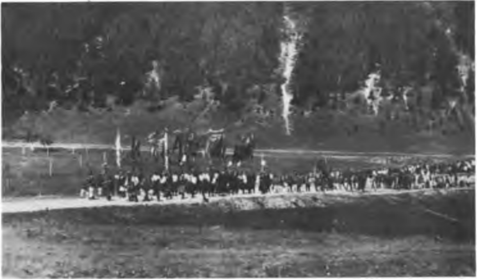
Процесія супроводжує єпископа із станції до Нижнева. 1932.

Розказуючи це, Владика був дуже сумний. Із цим його настроєм трагічно гармонізувала дальша реляція видіння, що вже торкалася його особистої долі.